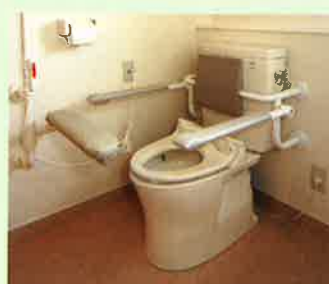
手すり付きトイレ