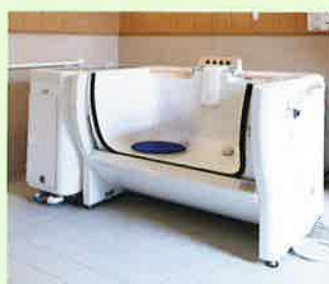
ソファバス (機械浴室)