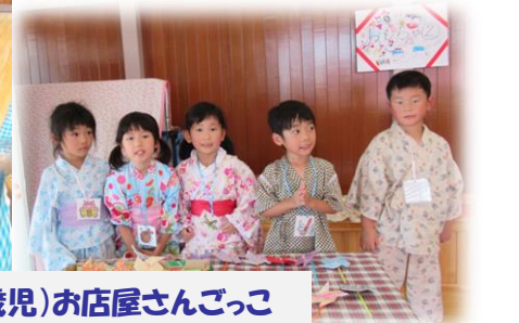
きいろ組(5歳児)お店屋さんごっこ