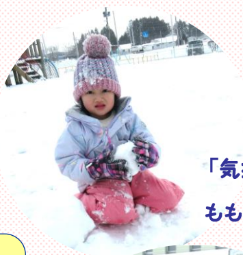
「気持ちいい！」 もも組(3歳児)