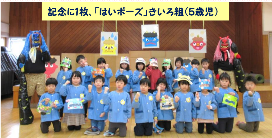
記念に1枚、「はいポーズ」きいろ組(5歳児)