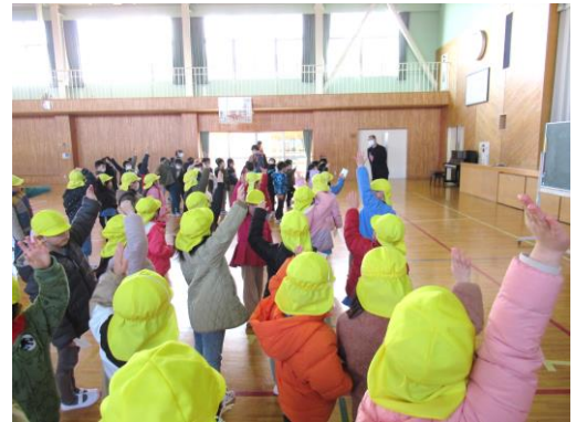
わらべ歌遊び 「お茶を飲みにきてください」