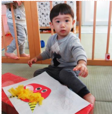
「かわいいね」青鬼さんより みるく組(0歳児)