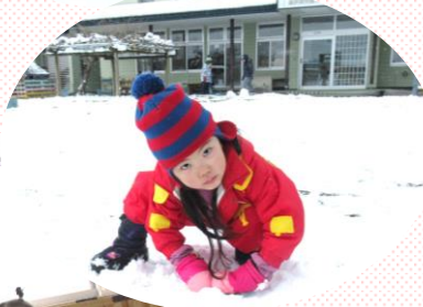
やっぱいり 雪遊び