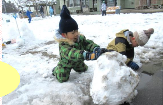
「雪だるま、お部屋に連れて行こう!」 みどり組(4歳児)