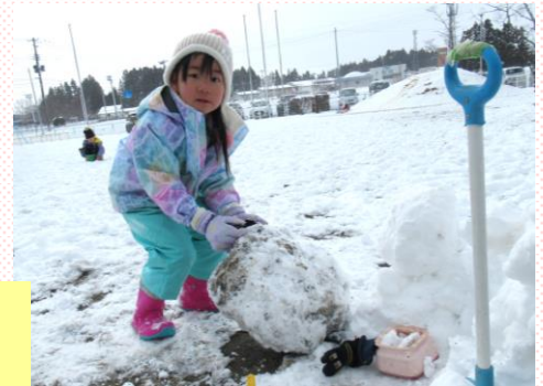
「上に乗せるね」みどり組(4歳児)