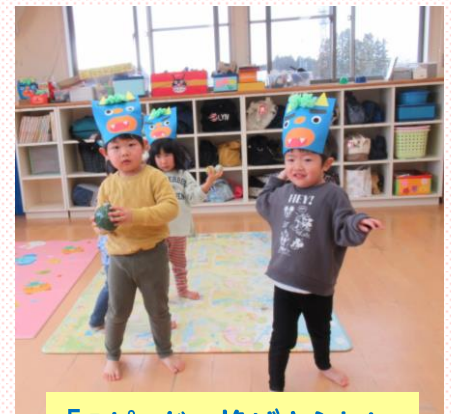
「スピードで投げようね!」 あか組(2歳児)