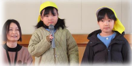
振り返りの場面 代表して感想を話しました