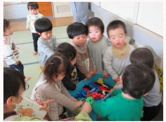
みんなでお片付け! みかん①組(1歳児)