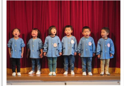
劇あそび[ももぐみ] 元気よく歌います！