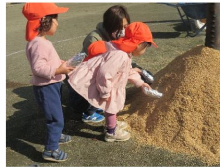
焼き芋会[おれんじぐみ] もみからにお芋を詰め込みます