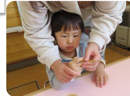
お箸の練習始まりました！ [おれんじぐみ]