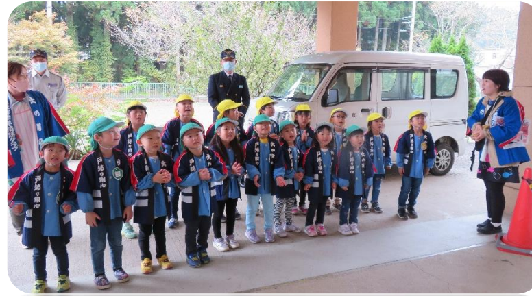
防火パレード[きいろぐみ・みどいぐみ] 近隣の施設に火の用心を呼びかけました