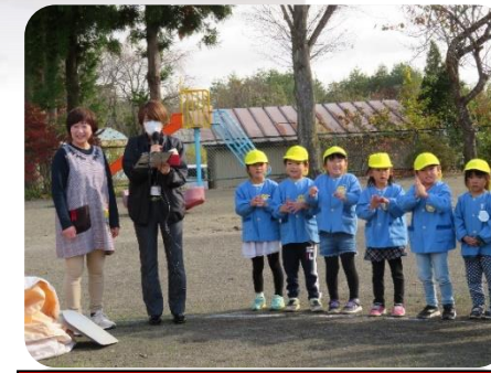
奥州FMさんのラジオに生出演！