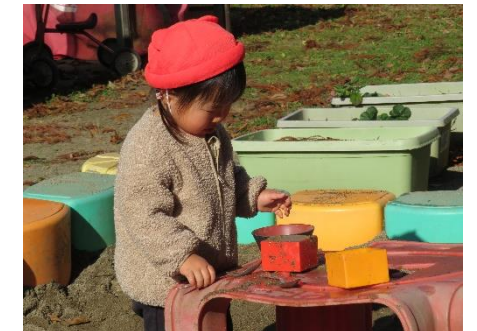
大きな砂場でお料理したよ！ [あかぐみ 1歳児]