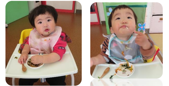
上手につまんで食べられるよ！ [あかぐみ 0歳児]