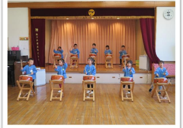
焼け石太鼓[みどいぐみ] 初めての太鼓にワクワクドキドキです！