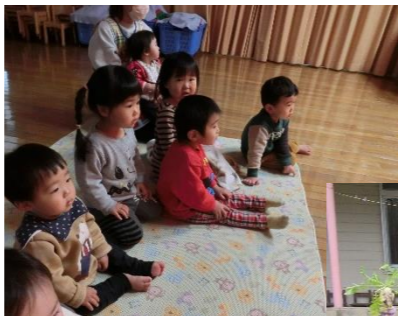
発表会の様子を 真剣に見つめます 【あか組 0・1歳児】