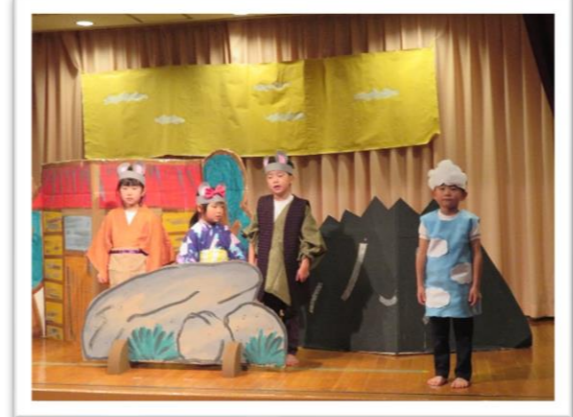
息がぴったり♪さすがきいろ組!! 【きいろぐみ 5歳児】