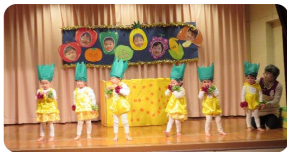
可愛いパイナップルが揃いました🍍 【おれんじぐみ 2歳児】