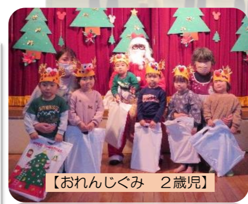
【おれんじぐみ 2歳児】