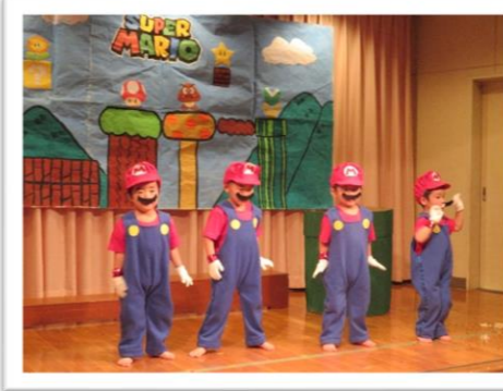
マリオになりきり踊ったよ! 【ももぐみ 3歳児】