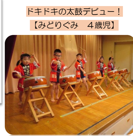
ドキドキの太鼓デビュー! 【みどりぐみ 4歳児】