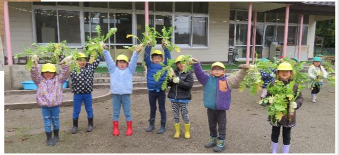
大根を収穫したよ!全部で38本でした!! ふるふき大根で「いっただっきま〜す😊」

今年はや暖冬と言われておりますが、朝晩の冷え込みや、積雪により道路が滑りやすくなっています。 登降園の際は、保護者の皆さんも、気持ちや時間に余裕を持って、今まで以上に車の運転に気をつけましょう。 また、駐車場から玄関までも大変滑りやすく、屋根からの落雪も考えられます。三角コーンの内側には入らないように十分に気をつけましょう。