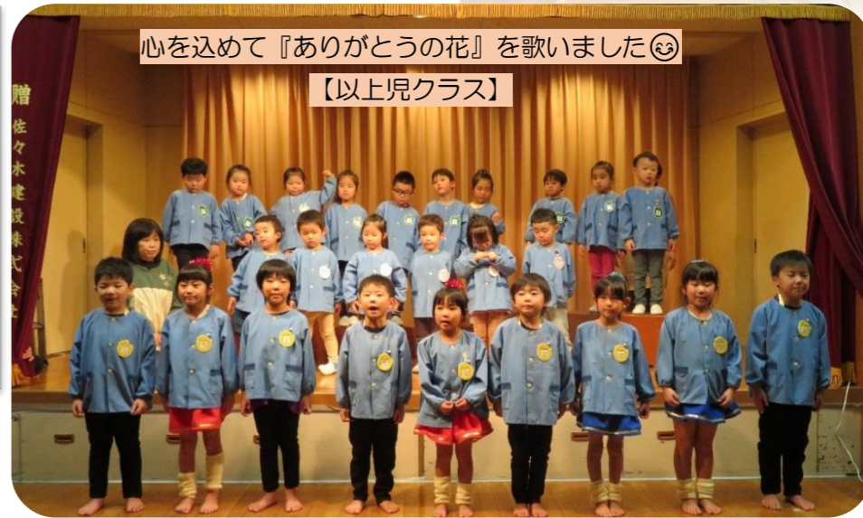
心を込めて『ありがとうの花』を歌いました😊 【以上児クラス】