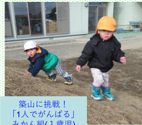
築山に挑戦！ 「1人でがんばる」 みかん組 (1歳児)