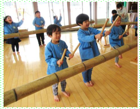
竹ばやし引継ぎ式 竹を打ってみました みどり組 (4歳児)