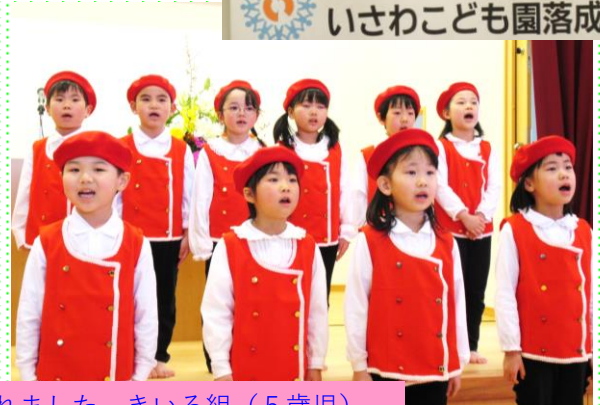
「ふるとさ」「園歌」を歌ってくれました。きいろ組 (5歳児)