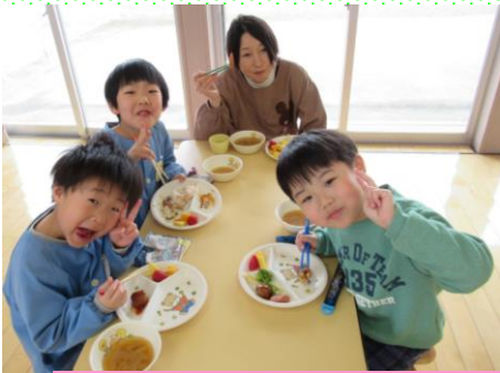
お別れ会 会食 「おいしいよ」 きいろ組 (5歳児)