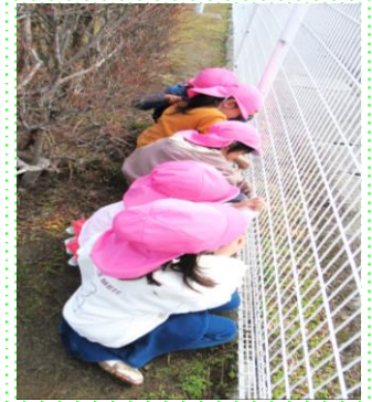
お花見つけたの もも組 (3歳児)