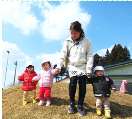
築山に挑戦！ゆっくり降りてね みるく組 (0歳児)