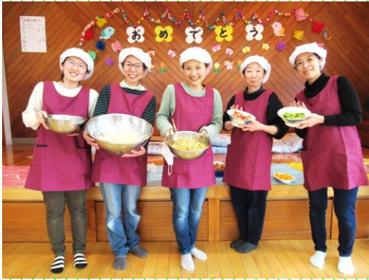
お別れ会「今年もおいしくできました」給食担当