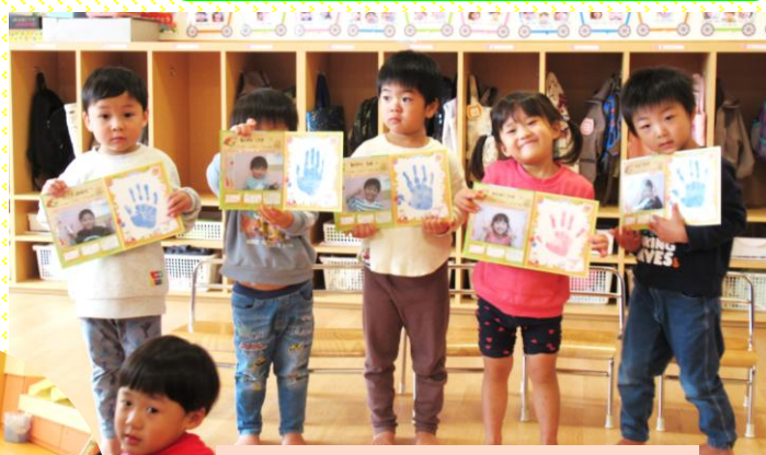
もも組(3歳児) 10月の誕生会 「おめでとうございます」 にこっ!