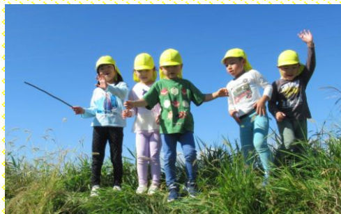
きいろ組(5歳児)遠足「あれ、何かな?」