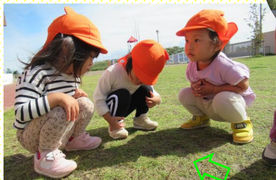
みかん①組(1歳児) 「これは?」「さわってみる?」「つかまえる?」 じーとしているトンボを見つけた3人。このそーと手を伸ばして、触ってみようとがんばりました。