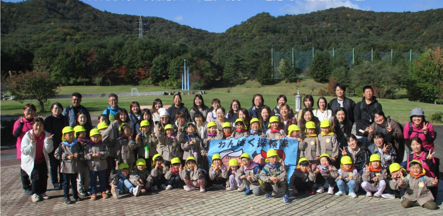
10/23(木) 5歳児(きいろ組) 親子バス遠足 於 花巻広域公園