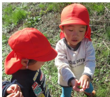
あか組(2歳児) 「カエル見つけちゃった！」

園庭で探索などを楽しんだ。広い以上児園庭のフェンスまでグングンと歩く子ども達。途中立ち止まったり、友達を追いかけたりしながら楽しんで歩いていた。園に戻ってきたきいろ組の子ども達にねこじゃらしや稲穂を見せてもらった。たっぷりと歩行を楽しみ、充実した秋の遠足となった。