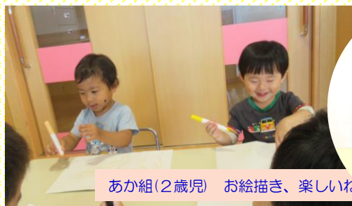
あか組(2歳児) お絵描き、楽しいね。