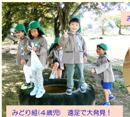
みどり組(4歳児) 遠足で大発見!