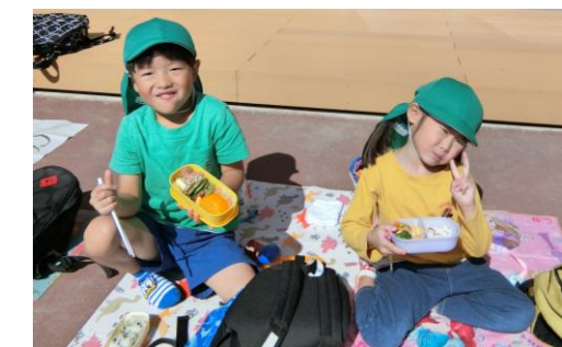
みどり組(4歳児)お弁当、最高！「おいしいよー」

数日前から「あと〇回寝たら遠足だよ」と毎日友達と話す子ども達。探検広場では、クヌギの帽子をたくさん見つけたり、大きなショウリョウバッタを見つけていたりして、大喜びする姿が見られた。園に戻り、お弁当は外で友達と誘いながら、一緒にシートを敷いて食べた。自分のシートを敷いて食べる準備を自分でできていて、成長を感じた。保育室に戻ったときに、「楽しかった」という言葉いっぱい何よりうれしい姿だと思った。