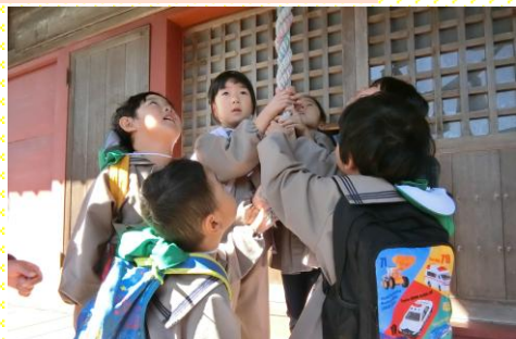
みどり組(4歳児) 神社でお願いをしました。 「おねがいします。叶いますように」