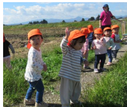
みかん①②組(1歳児) 「ようい、ドン」遠足楽しいね！

小学校の校庭の広場につくと喜んで走り始め、のびのびと体を動かして遊ぶことが出来た。カエルを見つけ捕まえたり、草花を摘んだりと一人一人が好きな遊びを楽しむ様子が見られ良かった。帰ってきてからはお待ちかねのお弁当。「おおきいおにぎり」と喜び、楽しそうな話声が聞こえていた。「遠足楽しかったね。また行こうね」という子の言葉を聞き、遠足が楽しい時間になったことが伝わる様子だった。