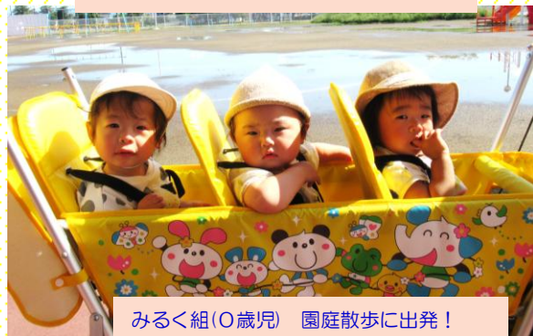
みるく組(0歳児) 園庭散歩に出発!