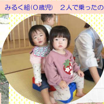
みるく組(0歳児) 2人で乗ったの