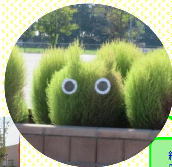
きいろ組(5歳児) 遠足に出発! 「トトロいる!」