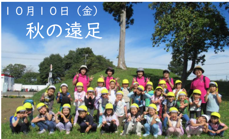
きいろ組(5歳児)角塚古墳にて