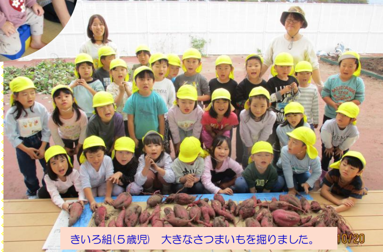
きいろ組(5歳児) 大きなさつまいもを掘りました。