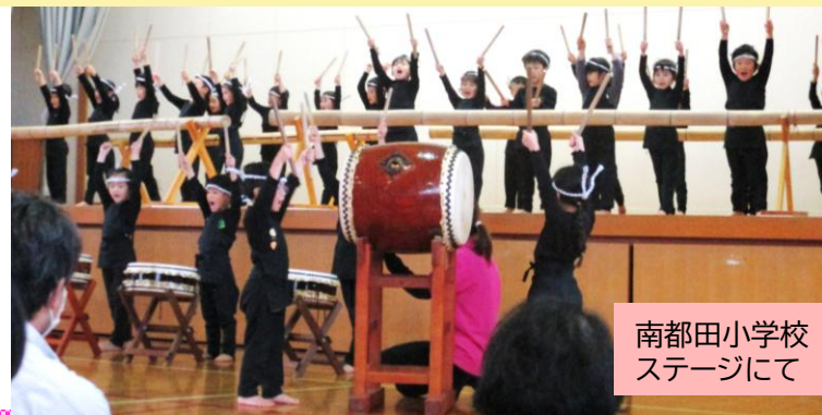
南都田小学校 ステージにて

本番を前に、何度か練習してみると、どのパートも合図やリズムをよく覚えていました。いよいよ当日。南都田小学校体育館に移動しました。ふれあい祭りのオープニングとして「いさわ竹ばやし」を大きなステージで披露しました。