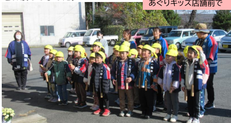
あぐりキッズ店舗前で