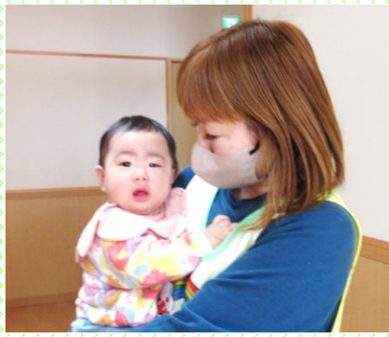
「はじめまして」みるく組（0歳児）