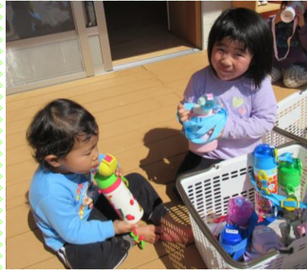
「広い園庭でたくさん走りました。自分の 水筒のお水を飲んで、もっと元気になりま した！！」もも組（3歳児）