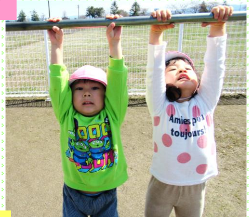
「おっきい所も届くよ」もも組（3歳児）