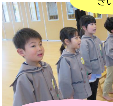
園歌を歌いました。

「チュールリップ」の歌や園歌をみんなで歌い、保育室やホールに可愛らしい声が響きました。