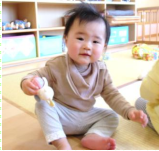
「カラカラ、いいね」 みかん②組（1歳児）