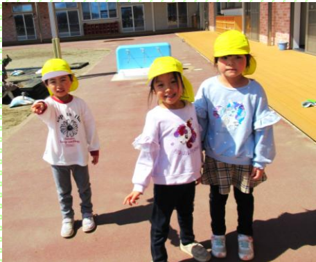
「あっちに虫がいたんだよ」きいろ組（5歳児）