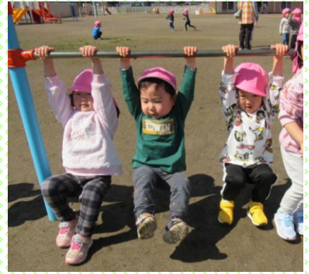
鉄棒に挑戦中! もも組（3歳児）