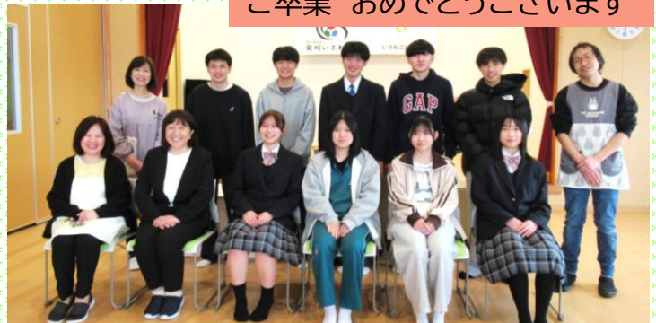
3月に胆沢中学校を卒業したみなさんが来てくれました。大 きくなっていて、名前を聞いてあの頃の姿を思い出しました。