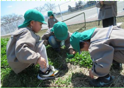
虫探しに夢中「青いお花の下にいるよ」 みどり組（4歳児）