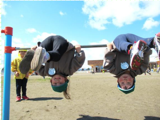
鉄棒に挑戦! 「できたよー」みどり組（4歳児）