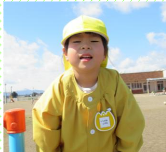
「難しいけど、がんばったよ！」 きいろ組（5歳児）