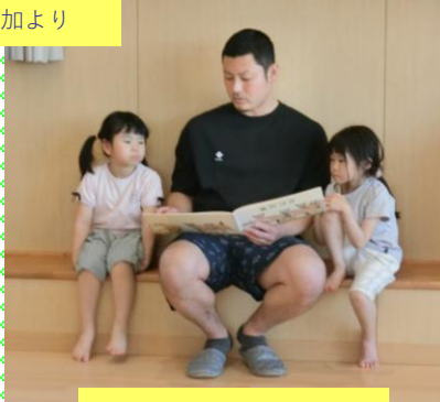
友達のお父さんに絵本を読んでもらいました。