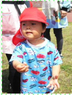
「かえる、つかまえたよ」