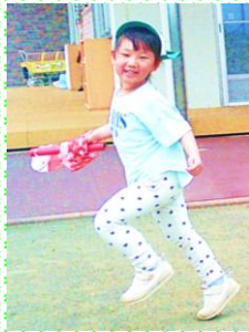
みどり組(4歳児)こども祭りこいのぼりリレー