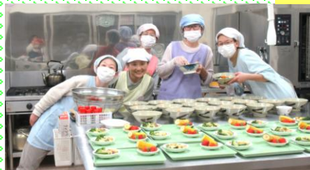
給食室の先生方「今日もおいしくできました」