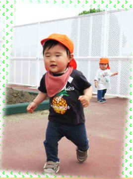
みかん②組(1歳児)「あるくの大好き!お外楽しいね」にっこり!