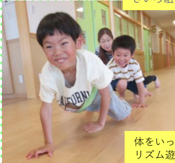
体をいっぱい動かして、リズム遊び