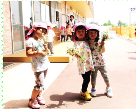
もも組(3歳児) 散歩に行ってきました。花束とポーズ