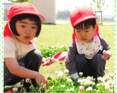
あか組(2歳児) 園庭にて! 「クローバーの中に…かえるがいるかも」