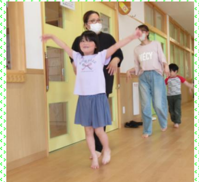
「ちょうちょ」になって、ひらひら!