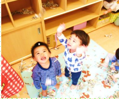
みかん①組(1歳児)「バラバラ、ふってくる」