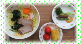
こども祭りのメニューです。