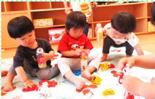
みかん①組(1歳児)ポットン落としに夢中です