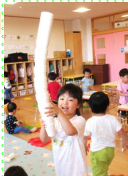
もも組(3歳児) 「こんなに重ねたよ。 たかくなった!」